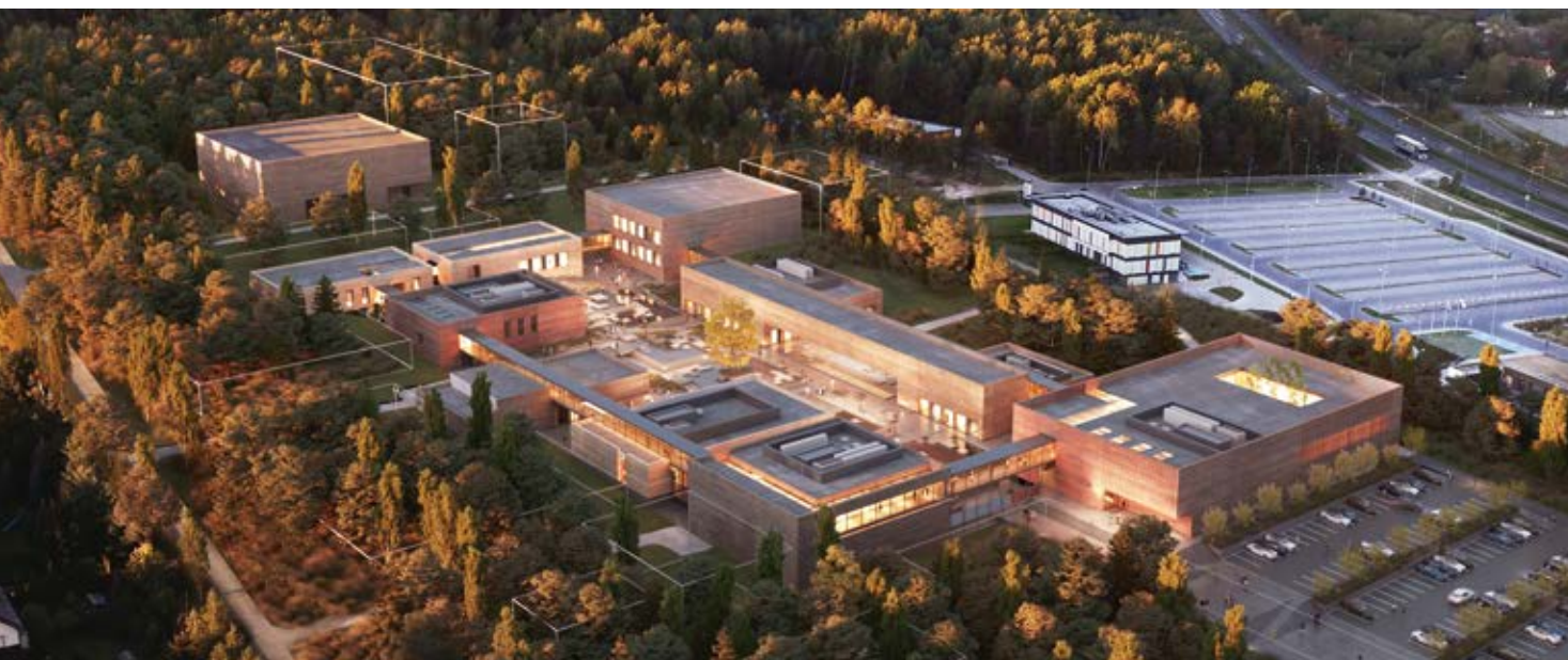
lider projektu