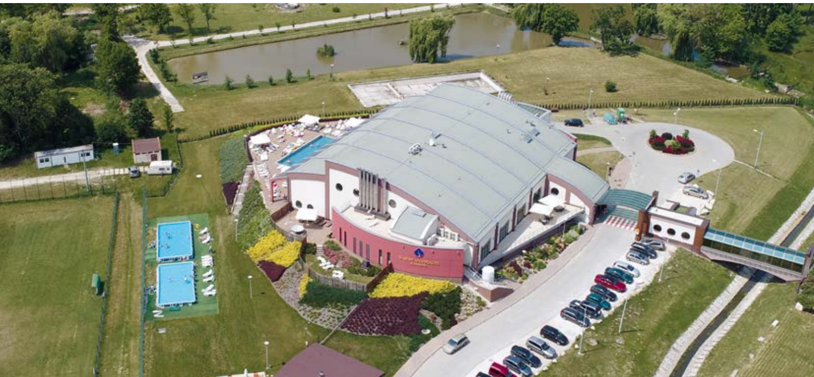
Kompleks Mineralnych Basenów w Solcu-Zdroju – pierwszy w kraju hybrydowy projekt PPP