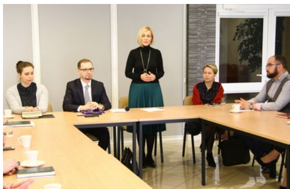
W grupie regionalnych interesariuszy projektu znalazło się kilkanaście świętokrzyskich podmiotów. Kolejny raz spotkają się w Kielcach, w połowie października br.

Województwo świętokrzyskie, zaangażowane w projekt poprzez udział w nim pracowników Departamentu Inwestycji i Rozwoju UMWS, ma szansę na wykorzystanie w przyszłej perspektywie finansowej ustaleń, wypracowanych przez ekspertów z regionów partnerskich, które pomogą realizować rodzimym beneficjentom efektywniejsze projekty z obszaru dziedzictwa kulturowego. Samowystarczalne, nastawione na zrównoważony rozwój, atrakcyjne turystycznie i kulturowo. W tym celu o pomoc w opracowaniu strategicznych dokumentów projektowych, które posłużą do dyskusji nad ulepszeniem dotychczas obowiązujących zapisów w regionalnych programach operacyjnych, poproszeni zostali przedstawiciele najważniejszych instytucji, działających w obszarze dziedzictwa kulturowego w regionie świętokrzyskim, m.in. Muzeum Wsi Kieleckiej, Regionalne Centrum Naukowo-Technologiczne w Podzamczu, Gmina i Miasto Chęciny, Muzeum Narodowe w Kielcach, Muzeum Okręgowe w Sandomierzu, Wojewódzki Dom Kultury w Kielcach, Pustelnia Złotego Lasu w Rytwianach, Zabytkowy Zakład Hutniczy w Małańcu, Kościół pw.