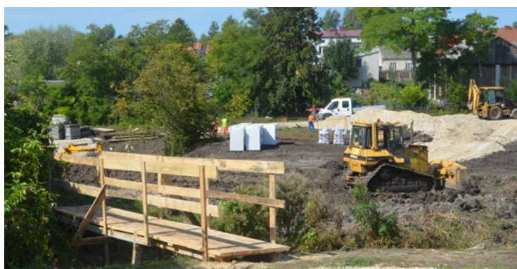
Umowę na realizację inwestycji podpisano w sierpniu br. Wtedy też wbito symboliczną „pierwszą łopatę”