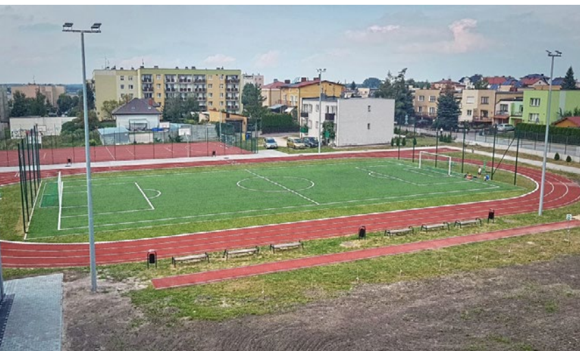
Publiczna Szkoła Podstawowa Nr 2 w Busku-Zdroju

Kolejny rok nauki w zupełnie odmienionych warunkach rozpoczęli też uczniowie Publicznej Szkoły Podstawowej Nr 2 w Busku-Zdroju. Ich szkoła została rozbudowana i zmodernizowana. Na dobudowanym piętrze znalazły się nowoczesne, świetnie wyposażone w komputery i tablice multimedialne pracownie przedmiotowe i językowe. Teraz każdy uczeń może pracować indywidualnie. Budynek ma windę i jest przyjazny dla osób z niepełnosprawnościami.