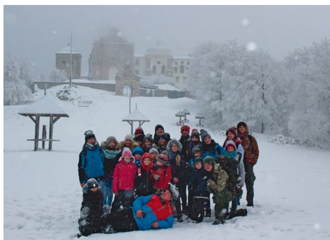
Dzieci i młodzież z powiatu jędrzejowskiego na wycieczce na Święty Krzyż, 2016 r.