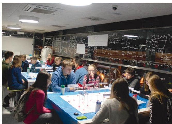
Dzieci i młodzież z powiatu koneckiego na zajęciach w Energetycznym Centrum Nauki, 2016 r.