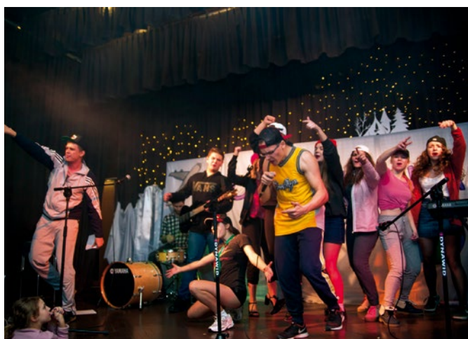
Młodzież z powiatu starachowickiego na Festiwalu Piosenki, 2017 r.