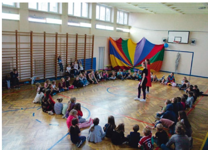
Dzieci z Kielc na obozie letnim, 2017 r.