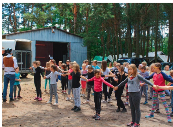
Dzieci z powiatu kieleckiego na biwaku wiosennym, 2018 r.