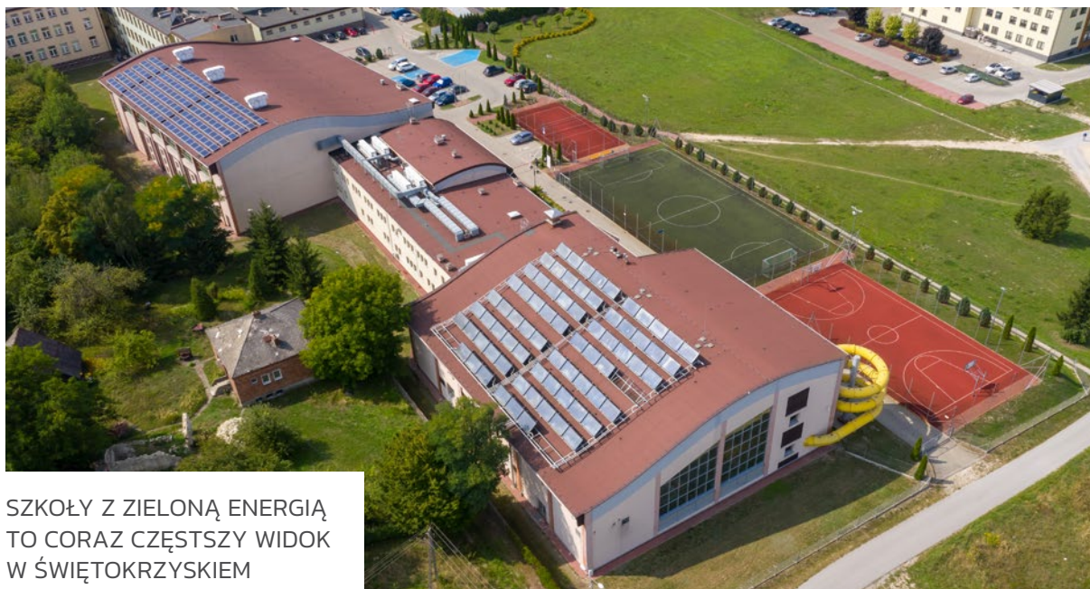
SZKOŁY Z ZIELONĄ ENERGIĄ TO CORAZ CZĘSTSZY WIDOK W ŚWIĘTOKRZYSKIEM