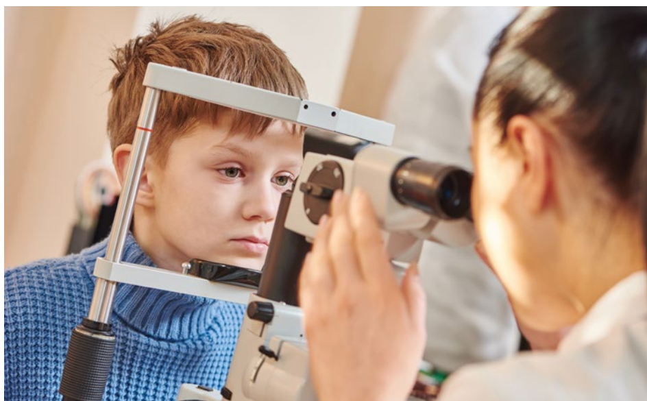
Pierwszaki ze wstępnie zdiagnozowanymi problemami z widzeniem zostaną w ramach projektu przebadane przez lekarza okulistę