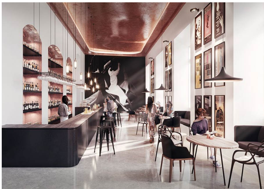
Przebudowa i modernizacja teatru potrwa około 3–5 lat

spirowane literaturą dziecięcą ścieżki tematyczne, małpi gaj, labirynt komiksu, ogród legend, grotę solną, zwierzyńiec i park fontann. Centrum zyska cenną przestrzeń rekreacyjną ze skateparkiem, strefą wypoczynku z ławeczkami i miejscem do grillowania, która będzie dostępna przez cały rok. Pozwoli ona na rozszerzenie oferty ECB i przyjęcie większej liczby odwiedzających. Dziś placówka przyjmuje ich 700 dziennie, a zamierza nawet 2 tysiące.