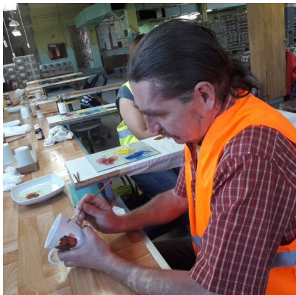
Projekt „Nowa Perspektywa”, realizowany przez Centrum Integracji Społecznej w Kielcach, powstał, aby pomóc osobom zagrożonym wykluczeniem społecznym w powrocie na rynek pracy