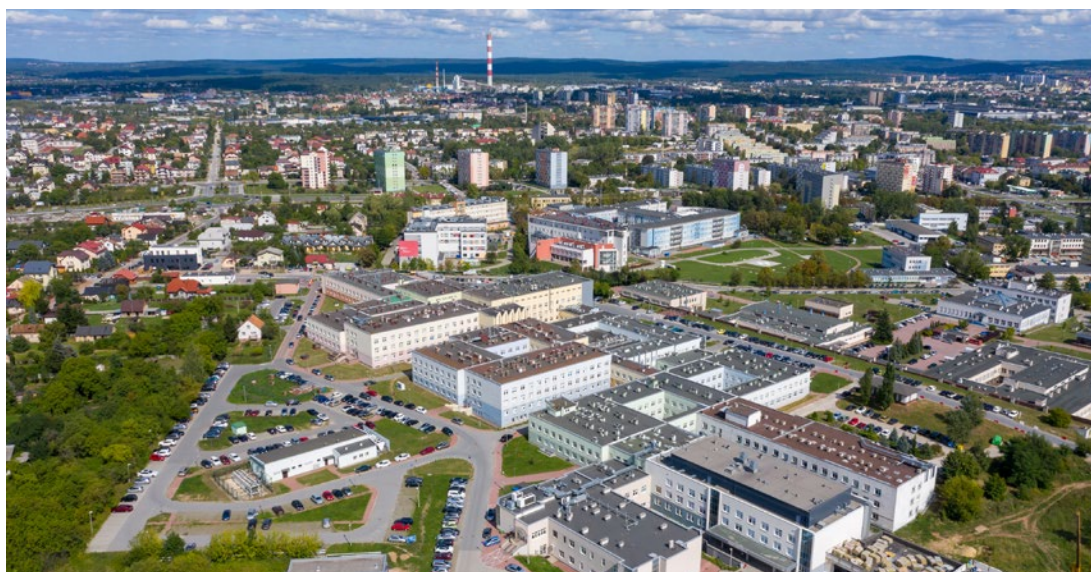
Zakup specjalistycznego sprzętu przez Świętokrzyskie Centrum Onkologii to gwarancja lepszej diagnostyki i skuteczniejszego leczenia

W sprzęt medyczny (m.in. aparat USG i EKG, pompy infuzyjne, bilirubinometr i defibrylator) zostanie w tym roku wyposażona staszowska pediatria, na oddziale zaplanowano również prace remontowe. Projekt, o ogólnej wartości ponad 1 mln 700 tys. zł, zyskał unijne dofinansowanie w wysokości prawie 1 mln 500 tys. zł. Staszowska lecznica realizuje również projekt o ogólnej wartości 3 mln 700 tys. zł, z unijnym dofinansowaniem w wysokości 3 mln zł, który zakłada rozbudowę i modernizację bloku porodowego.