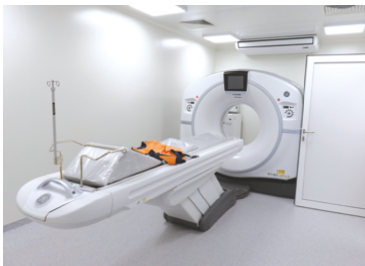
Nowoczesny tomograf trafił do lecznicy na kieleckim Czarnowie. Aparat został zamontowany w kontenerze, w bezpośrednim sąsiedztwie Szpitalnego Oddziału Ratunkowego

dotacje z Funduszy Europejskich. To pozwoliło na szybkie przekazanie dodatkowych pieniędzy wszystkim lecznicom w województwie. Łącznie wsparciem w ramach działań związanych z walką ze skutkami COVID-19 zostało objętych 18 szpitali wojewódzkich i powiatowych, a ogólna kwota dofinansowania z Europejskiego Funduszu Rozwoju Regionalnego wzrosła z początkowych 33 mln zł do 46,6 mln zł.