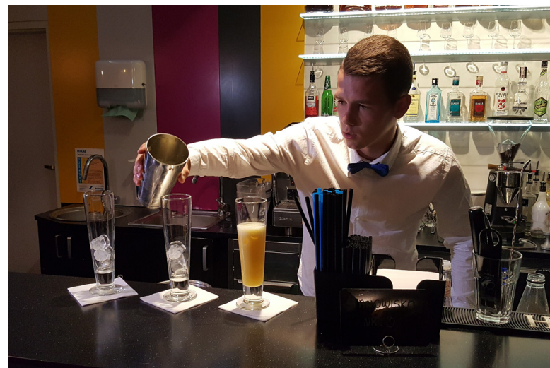
Uczniowie kierunku gastronomicznego z Zespołu Szkół Ekonomicznych w Kielcach przy ul. Langiewicza dzięki unijnemu wsparciu zdobywają wiedzę i umiejętności cenione na rynku pracy