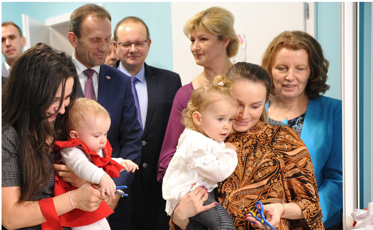
Przebudowany i świetnie wyposażony żłobek w Piekoszowie cieszy rodziców. Dzieci mogą uczestniczyć m.in. w zajęciach z logopedą i psychologiem

Więcej miejsc w świętokrzyskich żłobkach i pokrycie kosztów ponoszonych przez rodziców na zapewnienie opieki nad swoimi najmłodszymi dziećmi – to główne cele kilkudziesięciu projektów „żłobkowych”, które zostały dofinansowane w ramach Regionalnego Programu Operacyjnego Województwa Świętokrzyskiego 2014–2020 w ciągu ostatnich czterech lat. Dzięki blisko 51 mln zł unijnego wsparcia w licznych miejscowościach naszego regionu powstały nowe żłobki, kluby dziecięce, a wielu rodziców dostało pieniądze na zatrudnienie niani lub sfinansowanie pobytu dziecka w placówce.