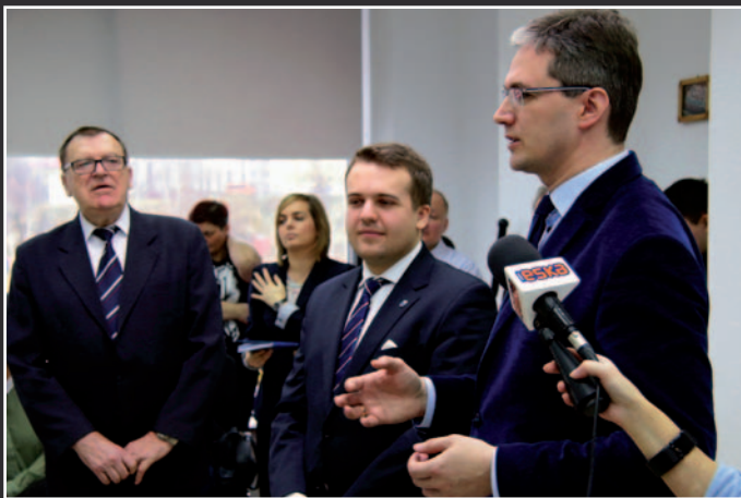
Spotkanie z seniorami, Starachowice 18.02.2016 r.