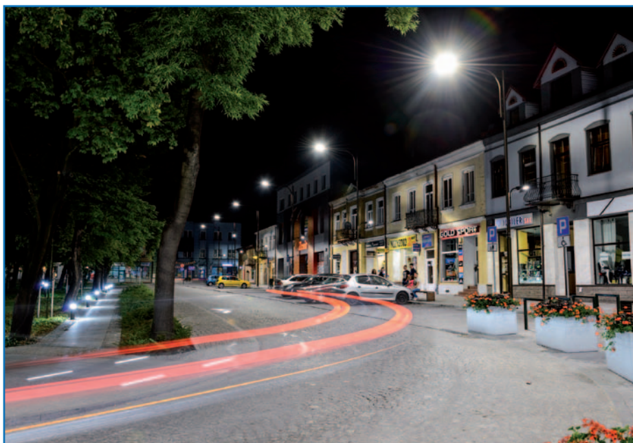
Wzrost estetyki i poprawa funkcjonalności przestrzeni publicznej miasta Busko-Zdrój RPOWŚ 2007–2013

Spacerując po Solcu-Zdroju widzimy przygotowania do wielkiej imprezy. Trwa montaż ogromnej sceny. To już IX edycja trzydniowego Międzynarodowego Festiwalu „Sztuka leczenia”, który jest organizowany na bazie dawnego Festiwalu Muzycznego im. Krystyny Jamróz. W obecnej formule pierwszy dzień wydarzenia odbywa się w Busku-Zdroju i obejmuje liczne koncerty muzyczne i warsztaty artystyczne. Dzień drugi i trzeci to liczne sympozja medyczne i dni otwarte w sanatoriach, prezentujących swoją ofertę leczniczą. Całość wieńczy wieczorny koncert „Bezcenne zdrowie”, transmitowany na żywo z Solca-Zdroju przez Telewizję Polską. Gośćmi tego wydarzenia jest międzynarodowa grupa inwestorów i właścicieli biur podróży, zaproszona przez Urząd Marszałkowski w ramach misji gospodarczej. Natomiast sąsiednia Kazimierza Wielka-Zdrój ma swoje coroczne wydarzenie – wrześniowe „Medycyna XXI wieku” w formie sympo-