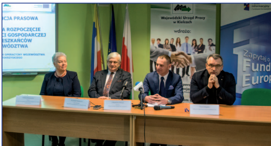
Konferencja nt. dotacji na rozpoczęcie działalności gospodarczej dla mieszkańców województwa

Obok podstawowego wsparcia dotacyjnego, „świeżo upieczeni” przedsiębiorcy będą otrzymywać wsparcie pomostowe w pierwszym, tj. najtrudniejszym, okresie funkcjonowania nowej firmy. W zależności od potrzeb, będzie to comiesięczne: wsparcie finansowe w wysokości najniższego wynagrodzenia na pokrycie, np. opłat na składki