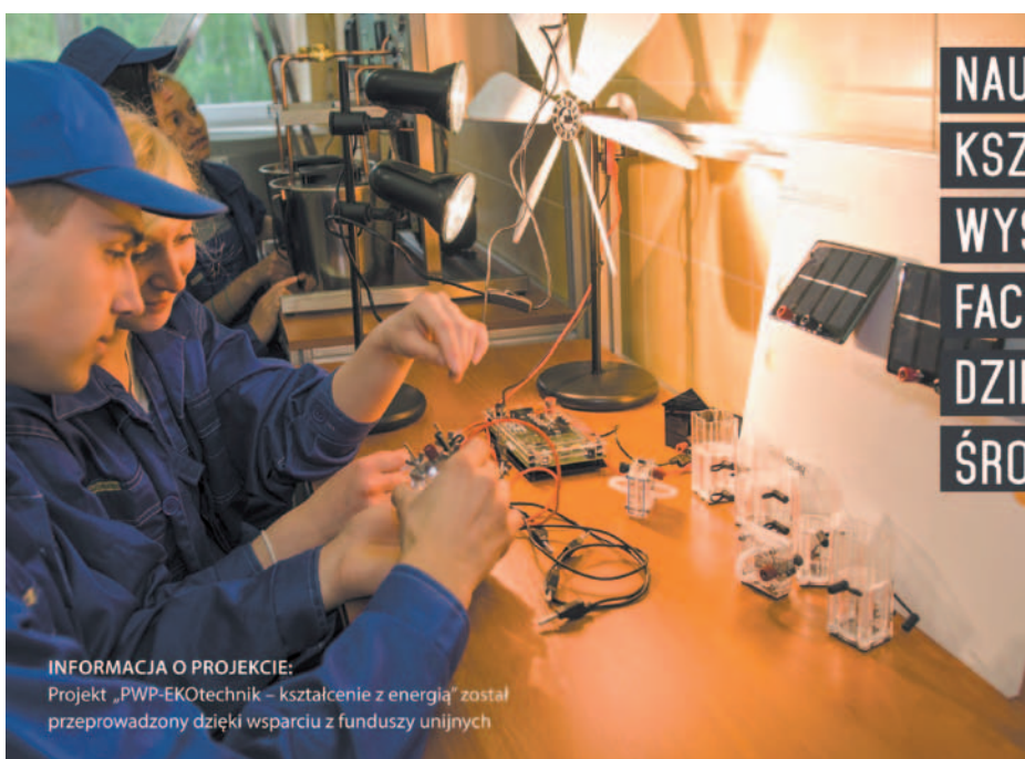
INFORMACJA O PROJEKCIE: Projekt „PWP-EKOtechnik – kształcenie z energią” został przeprowadzony dzięki wsparciu z funduszy unijnych

Zdaniem specjalistów z Oddziału Oceny Projektów Departamentu Wdrażania EFS, kluczem do jakości projektu są właśnie te dwa słowa – „regionalne potrzeby”. Projekt finansowany z Europejskiego Funduszu Społecznego powinien przede wszystkim stanowić adekwatną odpowiedź na prawidłowo zdefiniowaną potrzebę czy też problem konkretnej, określonej grupy osób. Generator Wniosków Aplikacyjnych, regulamin konkursu i towarzyszące mu różnego rodzaju wytyczne to ramy, w które należy ów pomysł „opakować”. Są ważne, ale nie najważniejsze. Z projektami konkursowymi jest trochę jak z akcjami na giełdzie. Każda firma, która chce, by jej walory były obecne na parkiecie, musi spełnić określone wymagania narzucone prawem. Tyle, że nie każde akcje warto kupować. Nieco upraszczając, można powiedzieć, że konkursy działają podobnie jak giełda – autorzy projektów oferują rozwiązania konkretnych problemów, a eksperci „wyceniają”, przyznając punkty za ich realną wartość. Projekty są „miękkie”, ale – jak na giełdzie – zasady ich realizacji twarde □