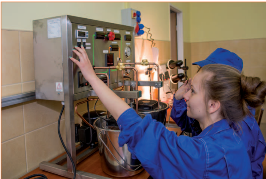
Projekt „EKOTECHNIK – kształcenie z energią”

przygotowywani są do montażu, obsługi, serwisu oraz projektowania i konstruowania systemów energetycznych wykorzystujących odnawialne źródła energii. Zmiany w profilu kształcenia starachowickiej szkoły wiążą się z trendami obserwowanymi na rynku pracy. Jak informuje Andrzej Kassenberg, prezes Instytutu na Rzecz Ekorozwoju, rozwój sektorów związanych z energetyką odnawialną i energooszczędnością w Polsce spowoduje powstanie kilkuset tysięcy miejsc pracy w perspektywie do 2035 roku.