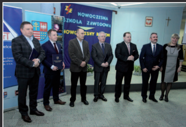
Konferencja nt.: Nowoczesna Szkoła Zawodowa – Nowoczesny Region – 23.02.2016 r.