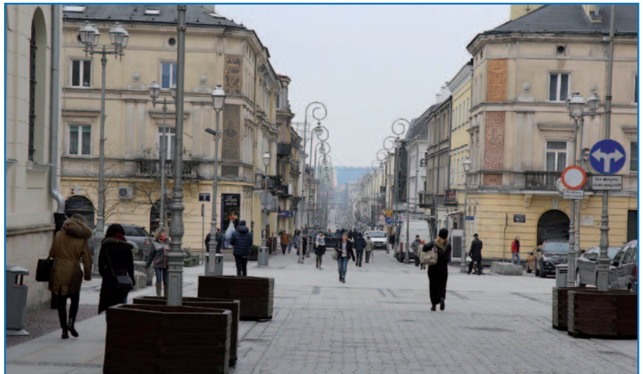
Rewitalizacja zabytkowego Śródmieścia Kielc RPOWŚ 2007–2013

celu zaplanowane jest przeprowadzenie przez powołany w Urzędzie Marszałkowskim zespół ds. rewitalizacji, trzech spotkań edukacyjnych dla wszystkich zainteresowanych gmin na terenie województwa świętokrzyskiego. Przedmiotem tych spotkań będzie prezentacja zarówno nowego podejścia do rewitalizacji, elementów i cech programów rewitalizacji, jak i przedstawienie kryteriów oceny tych programów.