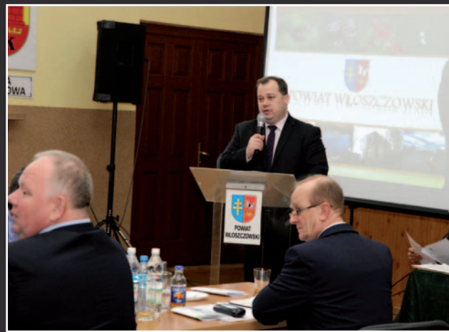
Posiedzenie Konwentu Powiatów Województwa Świętokrzyskiego we Włoszczowie, 19.02.2016 r.