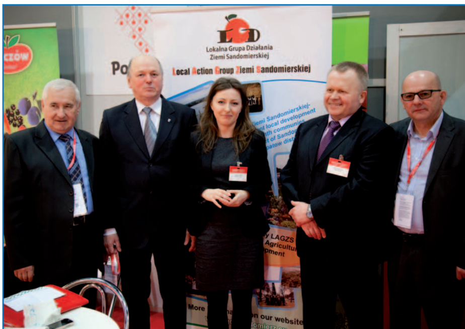
Targi przetwórstwa rolno-spożywczego – TAVOLA, Kortrijk (Belgia)

Dodatkowo, zorganizowaliśmy wiele spotkań B2B na temat możliwości inwestycyjnych i handlowych regionu, m.in. zainicjowaliśmy rozmowy Specjalnej Strefy Ekonomicznej w Starachowicach z przedsiębiorstwami z Luxemburga. Włączamy się także w cykliczne wydarzenia organizowane przez Komisję Europejską, m.in. Tydzień Miast i Regionów OPEN DAYS, gdzie współtworzymy warsztaty eksperckie w Brukseli