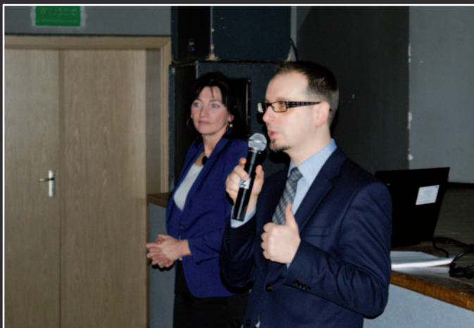
Konferencja pt.: Rewitalizacja 2014–2020 – Jędrzejów 03.03.2016 r.