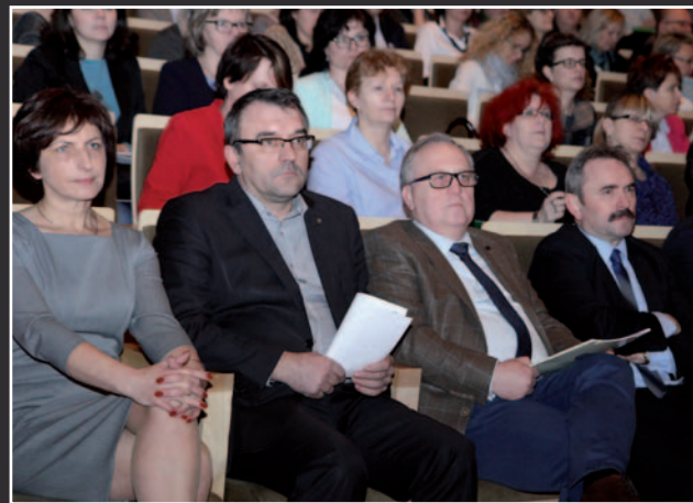
Konferencja nt.: „Możliwości wsparcia szkół i przedszkoli w konkursach ogłaszanych w 2016 r. w ramach RPOWŚ 2014–2020” – Kielce 29.02.2016 r.