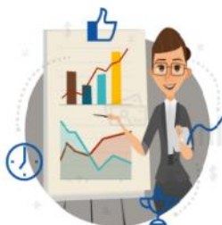
Przygotowanie projektu PPP