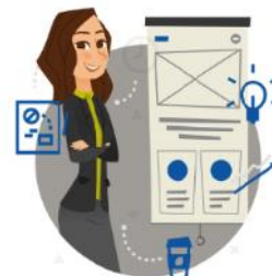
Zarządzanie umową o PPP