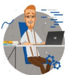
Wprowadzenie do PPP

ZAPRASZAMY NA BEZPŁATNE SZKOLENIA E-LEARNING Z ZAKRESU PPP