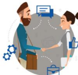
Wybór partnera prywatnego